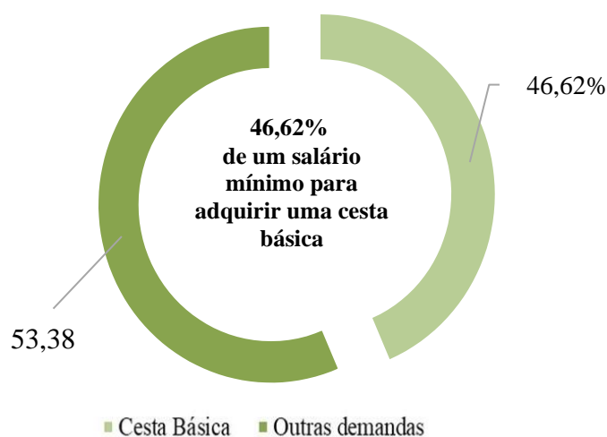
Figura 1 – Comprometimento do salário mínimo em relação ao custo da cesta básica (em %), novembro de 2022, Ilhéus, Bahia